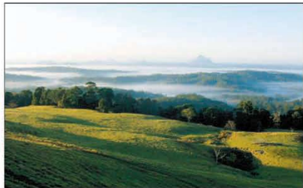
The Glasshouse Mountains Malenysa aamusumussa hotellimme parvekkeelta katsottuna.

Kurssiviikko viet edetessä tutustui ilalaisiin opiskeluvasta huomasin k australialaiset ovatensa ja ystävällisistä. Ystävällisyypintakiiiloista. Pulkeskenämme, he-