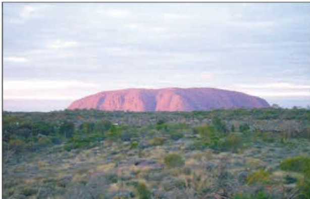
Uluru auringonlaskun aikaan.

Tämä matka oli kansainvälinen. Reissulle oli ilmoittautunut tämän energiahoidon parissa työskenteleviä henkilöitä Ruotsista ja Uudesta Seelannista, mukana oli myös australialaisia. Matka oli yhdistetty koulutus- ja virkistysreissu.