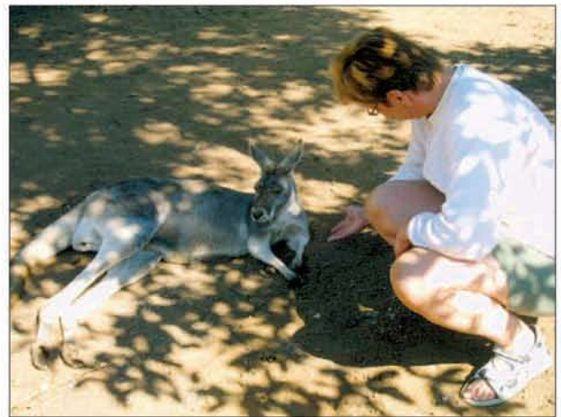
Herra kenguru ei hyppinyt, vaikka kuinka pyysin.

Kaikki kiva päättyy aikanaan. Kolmen päivän erämaassa vietetyn päivän jälkeen meitä odotti lento Uluru Resortista Sydneyn kautta Brisbanen. Jäljellä oli enää yksi yö Brisbanen Horstman-keskuksessa ennen kuin aloitimme kotimatkan. Jouduin lähtiessä vielä kerran tullisedän kynsiin. Laitteet piipusivat jälleen turvatakuksessa. Tällä kertaa kyse ei ollut paussikekseistä. Nyt piipauksen syynä oli sakset, jotka oli unohtunut reppuun.