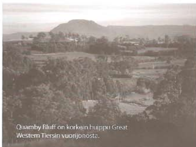
Quamby Bluff on korkein huippu Great Western Tiersin vuorijonosta.