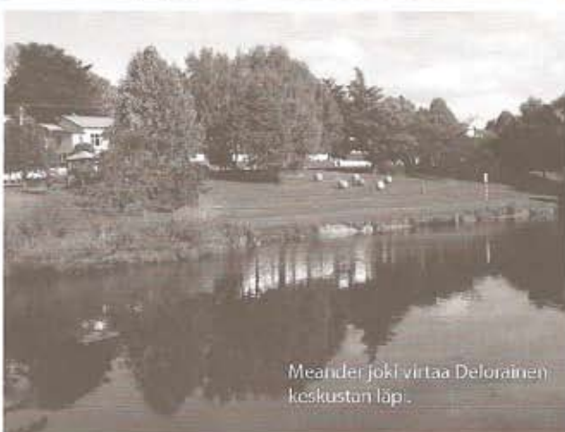
Meander joki virtaa Delorainen keskustan läpi.