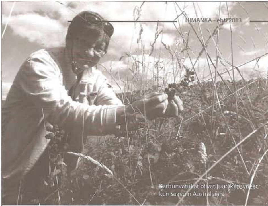
Karhunvatukat olivat juuri kypsyneet kun saavuimme Australiaan.