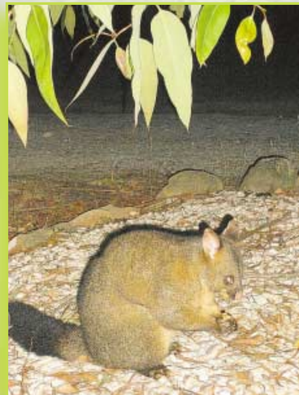
Ystävystyin Opossumiin niin hyvin, että syöttäessäni sitä se puraisi vahingossa sormestani, kun omenalohkossa ei ollut tarpeeksi kokoa.

Tämän jälkeen matka jatkui Golden Walley nimiseen laaksoon ja sieltä edelleen vuorille Mountainside Naure Retreat keskukseseen, jossa kurssi pidettiin. Kurssipaikka oli täysin vuoristoisen luonnon keskellä Quamby Bluff nimisen vuoren kyljessä.